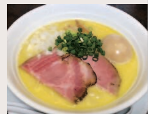
中華蕎麦しのざき