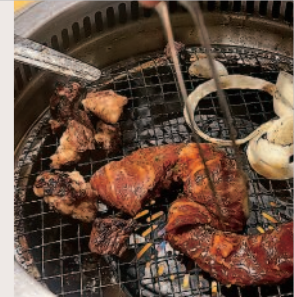
焼肉きんぐ宇都宮ゆいの杜店

清原工業団地や芳賀工業団地等に近接する、市東部地域の核となる拠点として開発されたのが、ゆいの杜エリア。相互の助け合いで発展するまちの姿を「結い」とし、その助け合いが自然豊かな地域（「杜」）にあることから「ゆいの杜」と名付けられました。造成から10年余り。閑静な住宅街が広がるこのエリアは、少子高齢化や人口減少が進む中でも子育て世代を中心に人口が増加し続けており、2021年には、市内で26年ぶりとなる新設の小学校「ゆいの杜小学校」が開校されました。町内には停留場が3か所。ライトラインが走る県道69号線沿いには、病院や塾、ホームセンターやスーパーのみならず、カフェやレストランなどの飲食店も立ち並び、作新大・作新短大生にとって便利なまち並みが続いています。