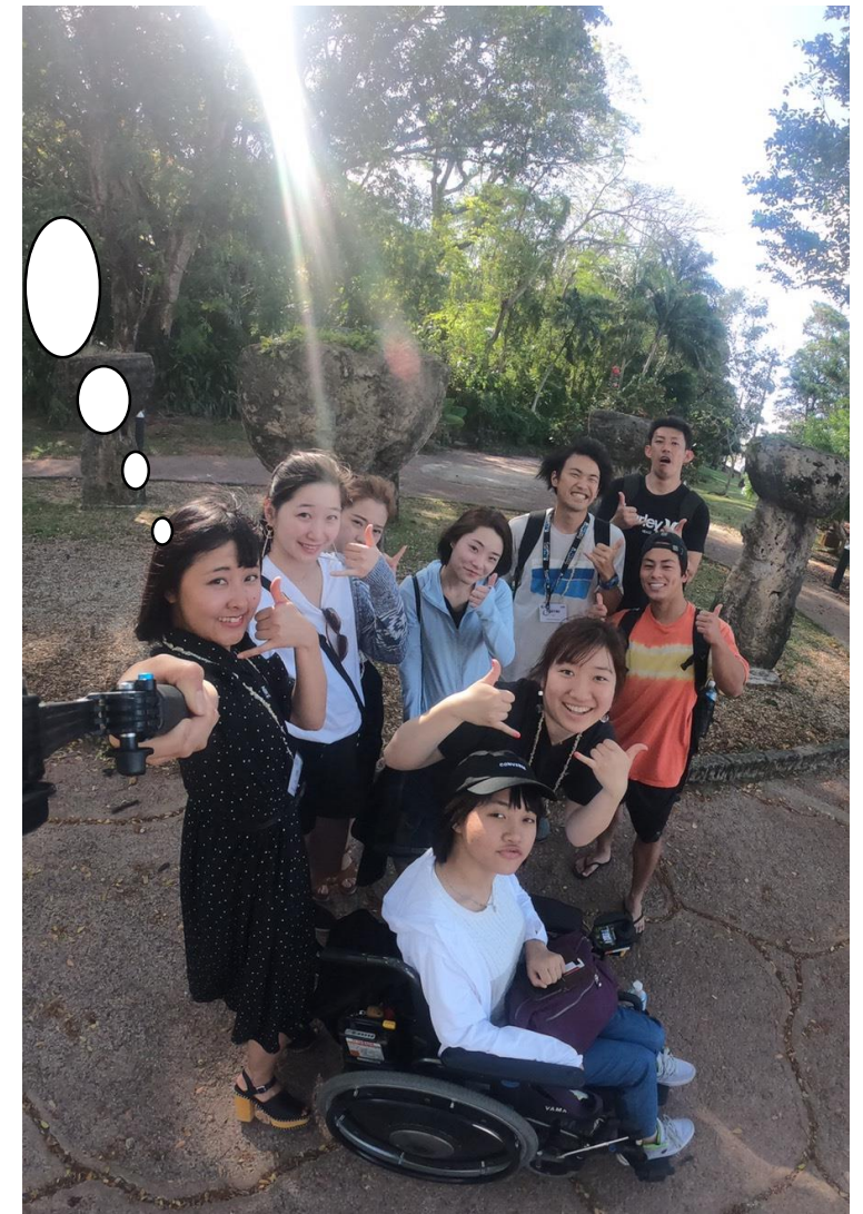
Santos Latte Stone Memorial Parkにて

※提携校のヴィンセンス大学では短期の語学留学から数年単位の本格的な留学まで、大幅に割引かれた料金で経験できます。