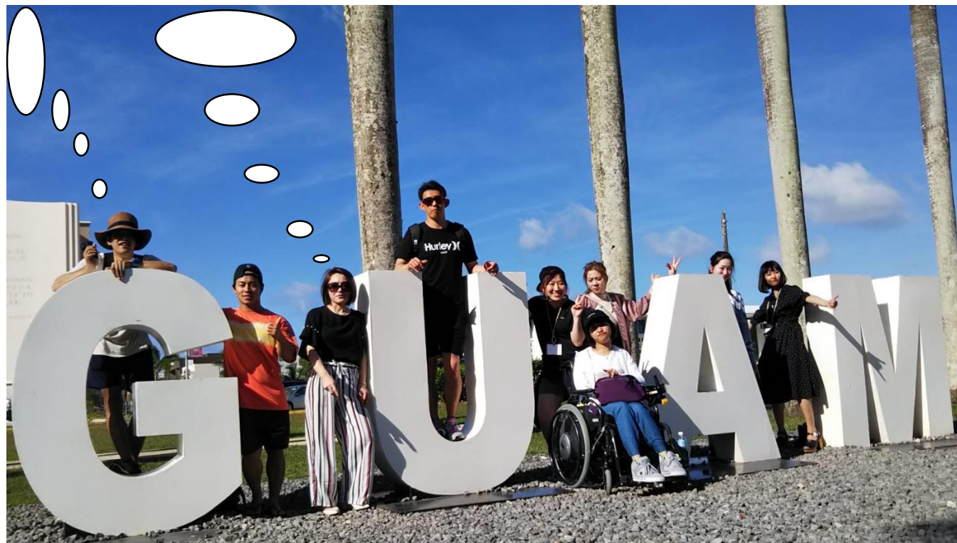
スペイン広場にて

十何年ぶりの英語はちょっとキツかったが、2週間経ってから、単語なら少しづつ分かってきました。グアムの研修をきっかけに英語をもっと勉強したい、話せるようになりたいという気持ちが強くなりました。また、先生たちのおかげで綺麗な観光地にたくさん行け、大満足でした。本当にありがとうございます。<経営学部4年>