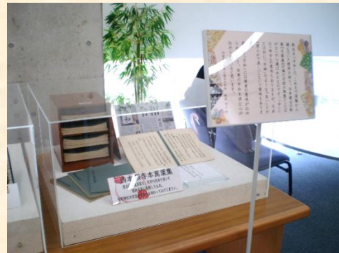
『西本願寺本万葉集』 (昭和8年発行 複製版)を 展示しました