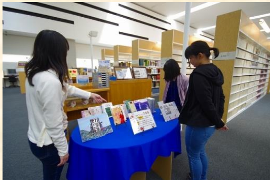
カウンター前に万葉集の関連書籍を展示しました

平成に代わる新しい元号「令和」が発表されました。典拠となった万葉集について、図書館に特設コーナーを設けました。