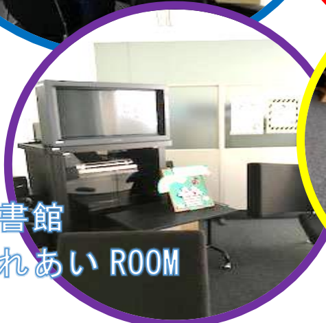
図書館 ふれあい ROOM