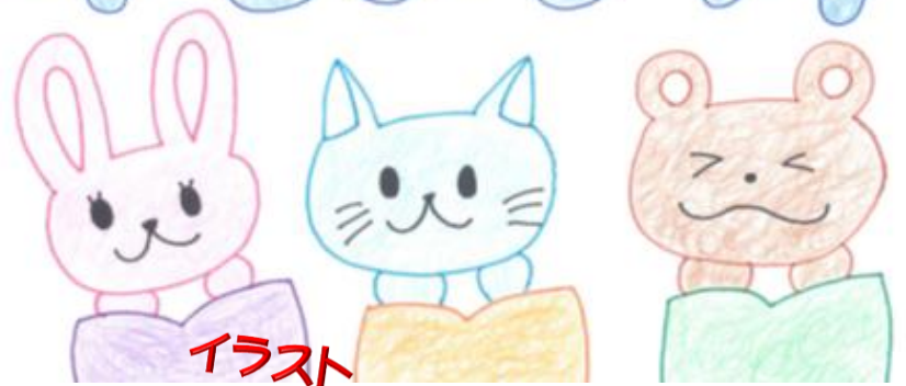
イラスト 人間文化学部 3年 若竹彩香