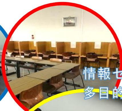
情報センター 多目的学習室