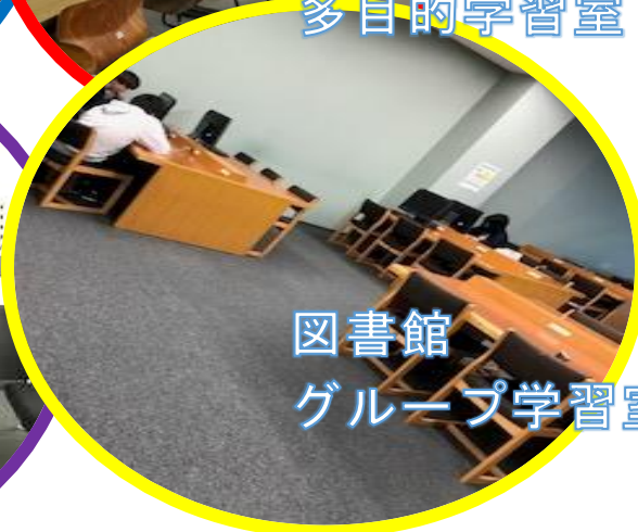
図書館 グループ学習室

ラーニング・コモンズは学生一人ひとりの主体的な学びを支援する場です。 グループで議論したり、学習発表をしたり、使い方はさまざま。 あなたの学びをより広く活発に深められるラーニング・コモンズをどうぞご利用ください。