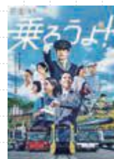
▲全世帯向けの本編