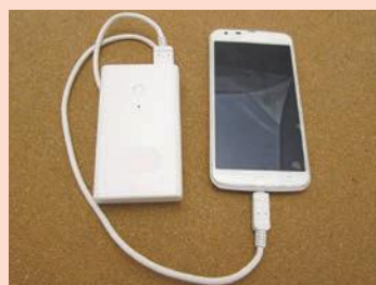
▲モバイルバッテリー