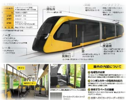
LRT の車両がこれ。カッコイイね～☆

作大生・作短生のみんな、こんにちは～☆ 宇都宮市のマスコットキャラクターのミヤリーだよ♪ 最近、キャンパスの周りで道路工事が多いと思わない？ 今、鬼怒川左岸の清原地区で、LRT（次世代型路面電車シ ステム）の整備工事が進んでいるの。 みんなが毎日通っている清原キャンパスの北側には、 「作新学院北」（仮称）の停留場が建設されるよ。宇都宮 市では、100 年先も安心して便利に暮らせるまちを目指し て公共交通の整備を進めているの。 みんなにも、LRT の事をもっと知ってほしいなあ。 ミヤリーも、みんなのキャンパスライフを応援してるかん ね（・▽・）☆