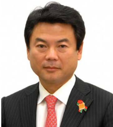
【写真】佐藤栄一 宇都宮市長