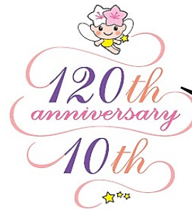
市制120周年・市町合併10周年記念ロゴマーク

今年は宇都宮市が生まれて120年、旧上河内町・旧河内町と合併して10年です。多くのイベントが予定されています。