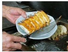
餃子のまち宇都宮