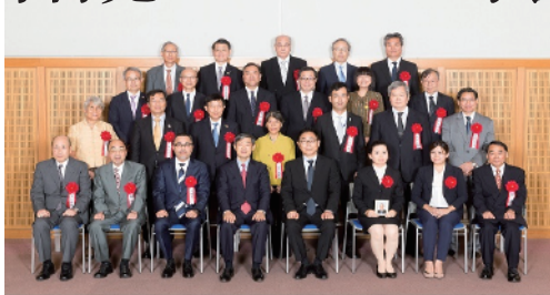
平成30年10月1日 第14回 JICA理事長賞表彰式 表彰式 JICA市ヶ谷ビル