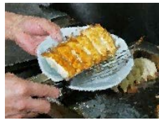
餃子のまち宇都宮