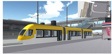
交通未来都市うつのみや

作大・作短キャンパスの北側には、LRTの停留場「作新学院北（仮称）」が計画されています。全国的にも注目されているLRTの魅力も、ぜひ学んで下さい。